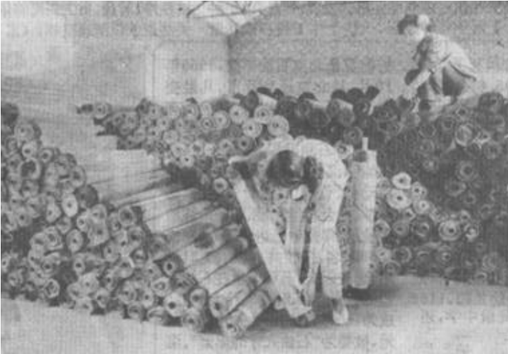
垦利县胜坨乡乡办企业，不断调整产品结构，上半年总收入达1913.4万元，比去年同期增长66.4%。图为该乡建筑安装公司新投产的全省独家产品——玻璃纤维布油毡，正待运出口创汇。

大改革开放份量的宣传；认真组织好干部群众的马克思主义理论学习；切实抓好新闻报道工作；抓好迎接建党70周年的准备工作；继续分层抓好思想政治工作；进一步抓好精神文明建设。为此，各级宣传部门要把握好一个中心两个基本点的宣传基调，继续进行坚持四项基本原则的宣传教育；做好意识形态战线的整体把握工作；围绕社会主义理论。(下转二版)